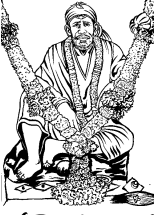
ఆగస్త్య సంచిక తరువాయి