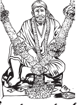
మే సంచిక తరువాయి